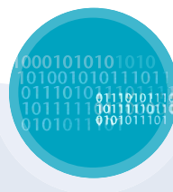
inside Gesellschaft für Lern- & Informationssysteme mbH