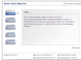
Lernkartei Riester-Rente, Allianz Lebensversicherungs-AG