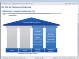
interaktives Lernskript Transportversicherung, Allianz Versicherungs-AG