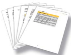
Schulungsmaterial Staatlich geförderte Rente, Commerzbank AG