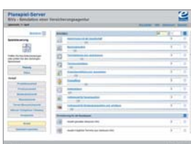
Plenspiel SiVa, Helvetia Schweizerische Versicherungsgesellschaft AG