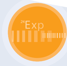
inside Gesellschaft für Mediendesign & Kommunikation mbH