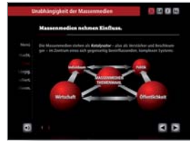
Point of Information Medienkompetenz, Internationales Zeitungsmuseum Aachen