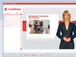
Virtueller Vortrag Vodafone TV, Vodafone D2 GmbH