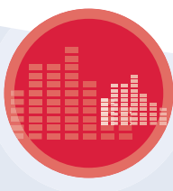
inside TV-, Audio- & Video-Produktion GmbH