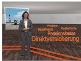
Virtuelles Studio Genius, Württembergische Versicherung AG