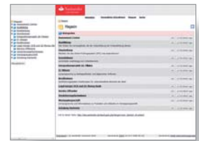
Lern-Management-System Aus- und Weiterbildung, Santander Consumer Bank AG