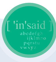
inside Verlag für neue Medien GmbH