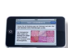
Mobile Learning Mikro- und makroskopische Pathologie, Universitätsklinikum der RWTH Aachen