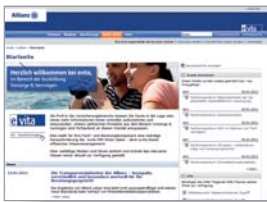
Performance Support evita, Allianz Lebensversicherungs-AG