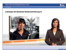
Lernprogramm BU-Invest, Allianz Lebensversicherungs-AG