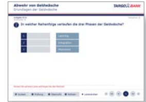
Online-Test (OPS) Geldwäschegesetz, TARGOBANK AG & Co. KGaA