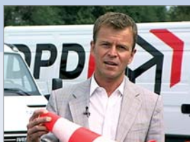
Film Fahrsicherheit, DPD GmbH & Co. KG