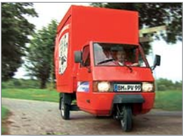
Vodcast Marketing, PresseVertrieb Köln