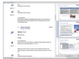
interaktiver Trainerleitfaden TrainerCockpit, Allianz Beratungs- und Vertriebs-AG